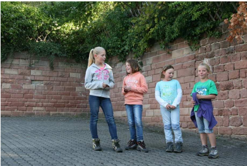
Live-Auftritt als Überraschung ☺