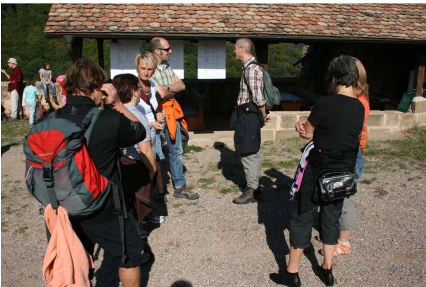
Rast Ruine Wolfsburg