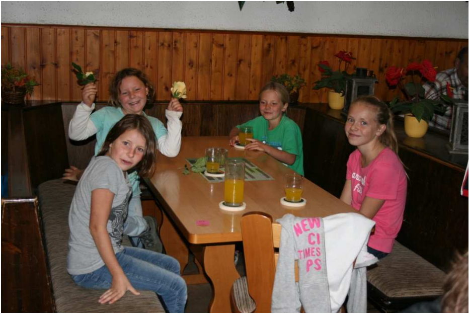
Pause Gasthaus am Weinbiet ...