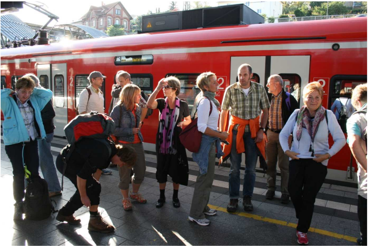
Ankunft in Neustadt