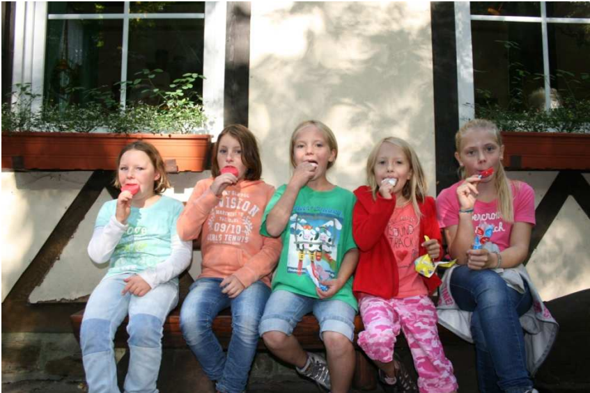
...und an der Looganlage