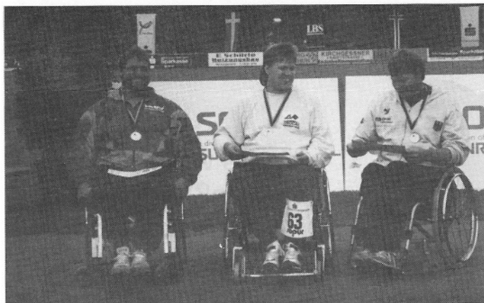
Frohe Sieger bei den Deutschen „Rollis“ - Kugelstoßer -