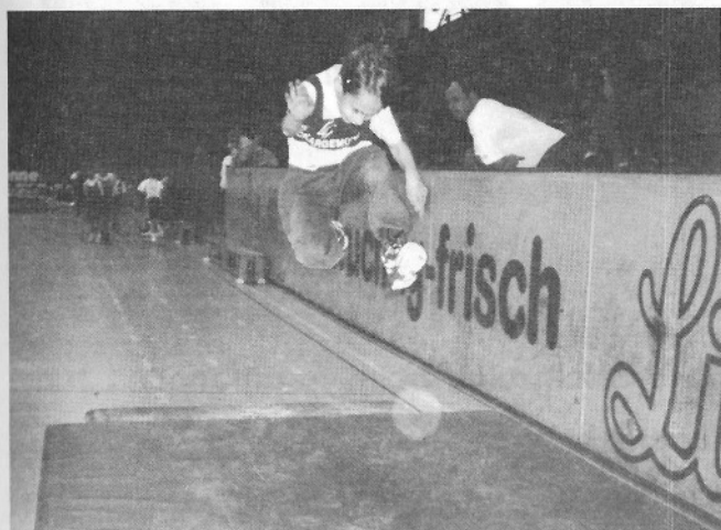
Der fliegende Hans (3,33m)